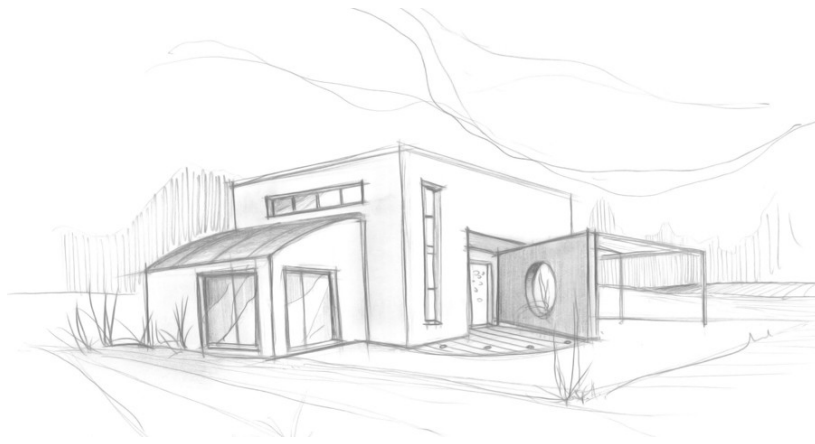
1. Représentation de Pierre.

Pierre, Jacques et Ibrahim souhaitent modéliser leur maison. Voici les représentations qu'ils viennent de réaliser :