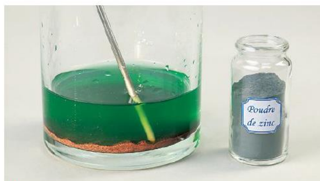
D On observe le contenu du cristalliseur.