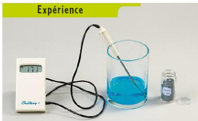
A On relève la température d'une solution de sulfate de cuivre contenue dans un cristalliseur.

On reproduit la transformation chimique qui a lieu en versant de la poudre de zinc dans une solution de sulfate de cuivre (cf. les photos d'expérience ci-dessous).