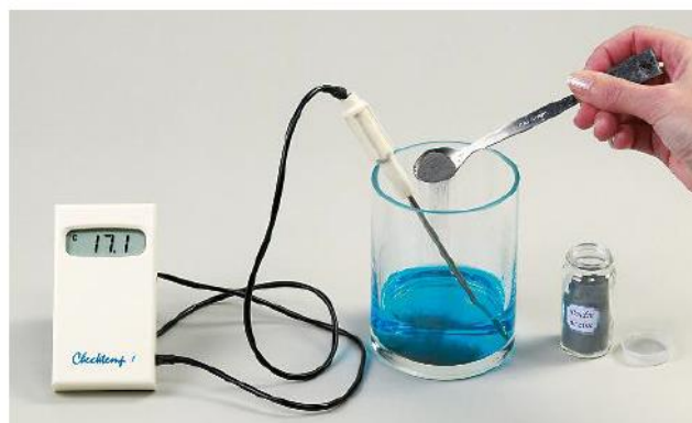
B On verse de la poudre de zinc dans la solution.