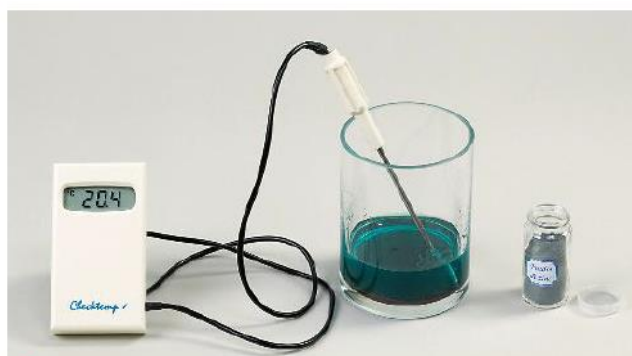
C On agite et quelques minutes plus tard on relève à nouveau la température. Une évolution de température indique l'apparition ou la disparition d'énergie thermique.