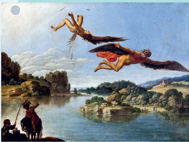
La Chute d'Icare , C. SARACENI, peinture à l'huile sur cuivre, vers 1600, musée du Capodimonte, Naples, Italie.

Lisez le texte d'Ovide et soulignez le passage qui pourrait servir de légende à l'image.