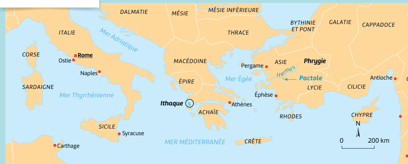
L'Empire romain à son apogée (détail)