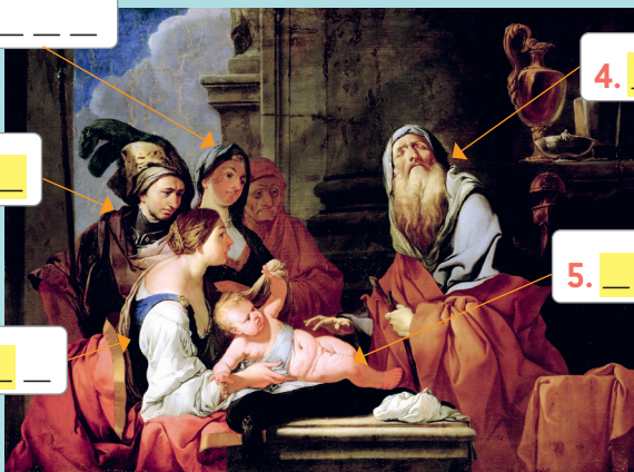
G. CARPIONI, Le Devin aveugle avec Narcisse bébé , huile sur toile, vers 1666, Gemäldegalerie Alte Meister, Kassel, Allemagne.