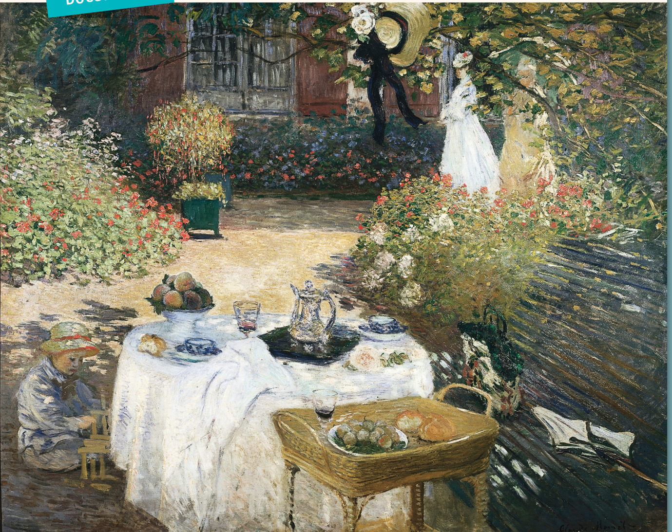
Claude Monet (1840-1926), Le Déjeuner , vers 1874, huile sur toile, 160 x 201 cm, Paris, musée d'Orsay.