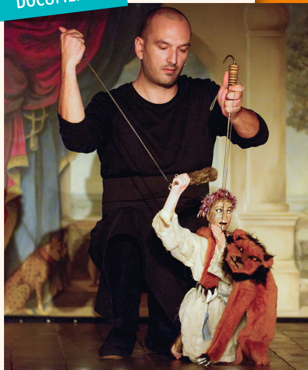
Opéra-bouffe Caligula Delirante de Pagliardi , Institut national de la marionnette de Charleville-Mézières, mars 2012.

CALIGULA. – Bien sûr, mon ami, bien sûr. Mais comme c'est commun ! ( Il a déjà la femme près de lui et lèche distraitement son épaule gauche. De plus en plus à l'aise. ) Au fait, quand je suis entré, vous 40 complotiez, n'est-ce pas ? On y allait de sa petite conspiration, hein ?