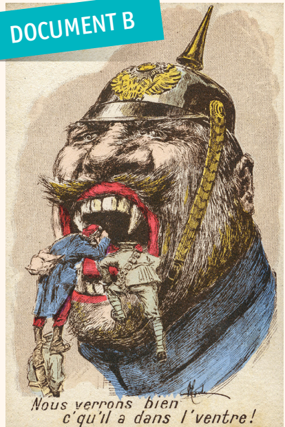
« L'ogre. Nous verrons bien c'qu'il a dans l'ventre ! », soldat français regardant dans la bouche de l'allemand, illustration anonyme pour une carte postale vers 1914.

35 d'une femme et d'une petite fille, de menues photographies d'amateur prises devant un mur de lierre. À côté d'elles il y a des lettres. Je les sors et j'essaie de les lire. Je ne comprends pas la plupart des choses ; c'est difficile à déchiffrer et je ne connais qu'un peu de 40 français. Mais chaque mot que je traduis me pénètre, comme un coup de feu dans la poitrine, comme un coup de poignard au cœur... [...] J'ouvre le livret et je lis lentement : « Gérard Duval, typographe. »