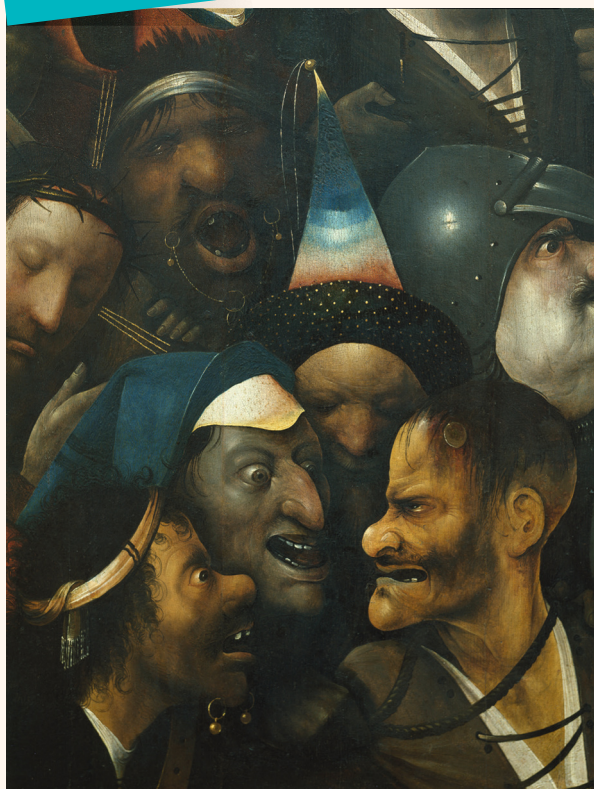
Jérôme Bosch (vers 1540- 1516), Le Portement de la Croix , 1515-1516, huile sur bois, 76,7 x 83,5 cm, Gand, musée des Beaux-Arts.