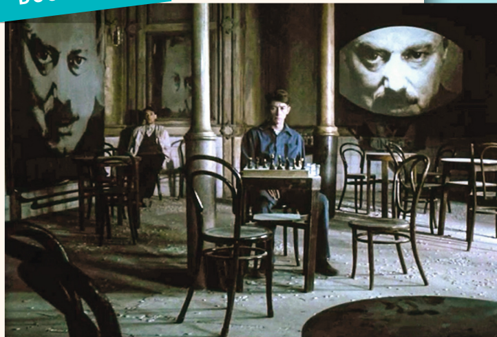
Image du film 1984 , de Michael Radford, 1984.