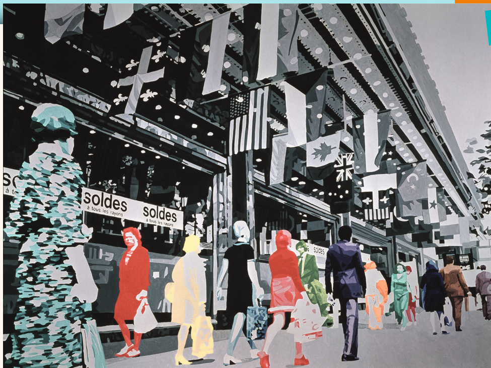
Gérard Fromanger (né en 1939), Au Printemps ou La Vie à l'endroit , 1972, huile sur toile, 150 x 200 cm, coll. privée.