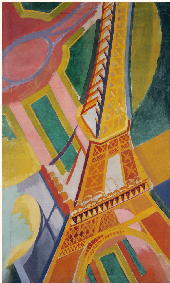
Robert Delaunay (1885-194), Tour Eiffel 6 , 1926, huile sur toile, Paris, musée d'Art moderne.

Exemple : Le point de vue plongeant adopté par Delaunay, le format vertical et le cadrage qui coupe la tour Eiffel accentuent l'impression de gigantisme. Les lignes dynamiques qui traversent le tableau dans toutes les directions et l'emploi de couleurs gaies participent de la célébration de la modernité.